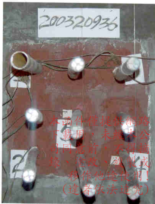
照片1 耐火试验前试件情况