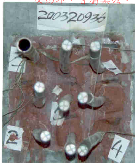
照片2 耐火试验结束时试件情况